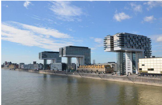
Start und Ziel: Köln, Rheinauhafen